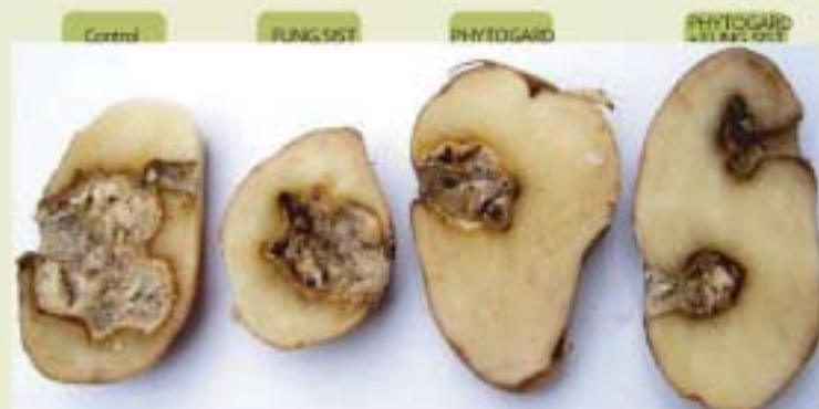
Severidad de Fusariosis en tubérculos de cultivar Umatilla Russet provenientes de plantas tratadas.