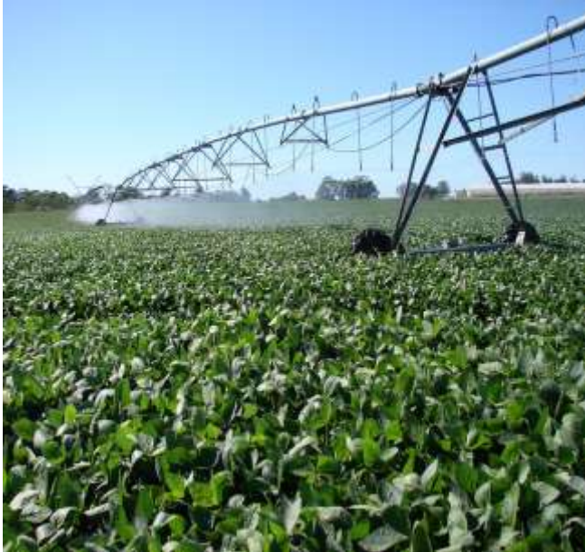
Vista general del ensayo.

Durante todo el ciclo de cultivo, el ensayo se desarrollo con objetivos de alto rendimiento y el complemento de riegos regulares bajo un sistema de pivote central.